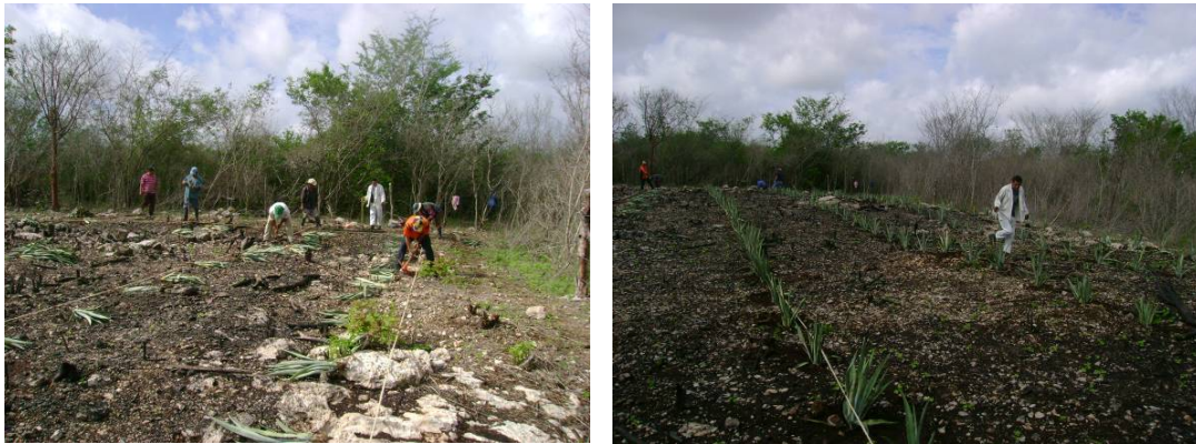
Trazado y establecimiento de una plantación

Como la zona donde se siembra henequén el terreno es muy pedregoso y en la poceta que se coloca la planta no hay suficiente tierra para que la planta se fije por sí misma, la planta se sujeta al suelo empleando piedras a los lados de la planta, o las piedras se usan para presionar las hojas bajas de planta, esta práctica se usa con el objeto de evitar en ambos caso que los vientos u otro factor derriben al vástago.