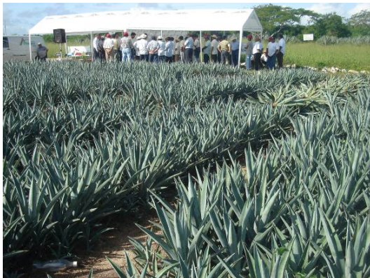
Manejo de semilleros

Una característica de los agaves es que poseen tres formas naturales de propagación, la emisión de rizomas a través del sistema radicular, la generación de hijuelos denominados bulbillos en la inflorescencia. Estas dos formas se dan de manera asexual, lo que significa que las plántulas generadas serán idénticas a la planta que les da origen y también a partir de la floración se obtiene semilla, la cual generalmente produce plantas débiles, de lento desarrollo y generalmente mueren.