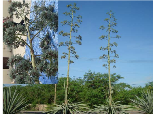
Decadencia y posible reinicio

La demanda de fibras naturales se encuentra nuevamente en auge impulsada mayormente por países desarrollados, los cuales buscan la reducción del uso de productos contaminantes y tendencia a lo natural. Esta expectativa parece representar ventajas a los países productores de fibra entre los que se encuentra Yucatán, a pesar de haber decaído en producción y productividad en forma por demás preocupante. Como referencia del declive que se vive con la producción, en la década de los ochenta del siglo pasado se cultivaban 24,000 ha y se producían 6,500 toneladas de fibra; para 2010 se cultivan cerca de 12,000 ha y se producen unas 5,500 ton.