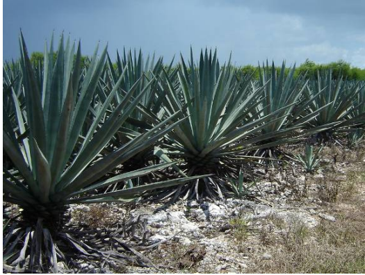
Plantación en producción