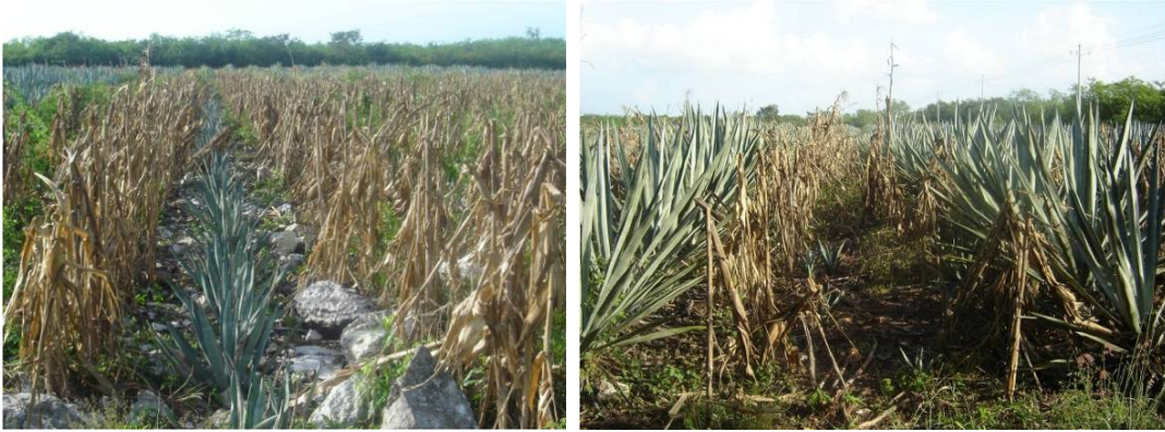
Intercalado de maíz al henequén en un segundo y tercer año del henequén

Además el intercalado de maíz – frijol lb eficientiza el uso del suelo, y se aprovecha un terreno ya preparado, ahorrando labores al productor que no tendrá que preparar otro terreno para la siembra del maíz y puede generar un ingreso para el campesino durante la etapa improductiva del henequén ya que para iniciar la cosecha de este es necesario que transcurran hasta seis años, además las labores de mantenimiento y cuidados del maíz benefician al henequén al eliminar maleza.