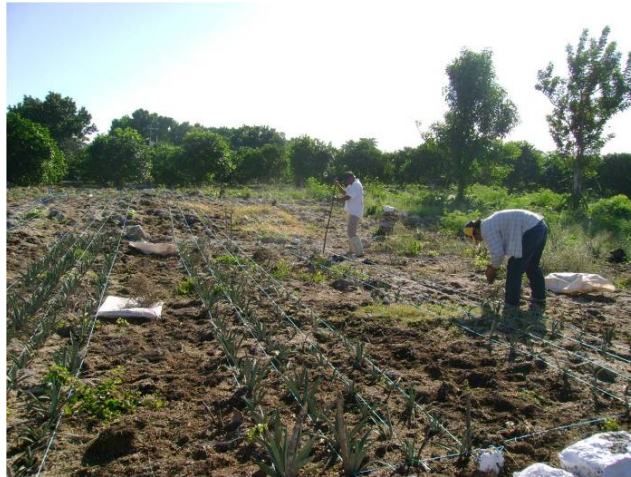
Trasplante en semillero usando hilos y “sembrador”

Otra fuente de material vegetativo son los bulbillos o plántulas producidas en el varejón; estas se pueden obtener a partir de plantas de henequén ubicadas en parques o jardines o de plantas en decadencia de planteles que sean tratadas con fungicidas e insecticidas para el control de enfermedades y plagas que atacan al varejón y a los bulbillos. También puede usarse material vegetativo proveniente de cultivo de tejidos, sin embargo este material es un poco difícil de obtener en la región debido a sus altos costos.