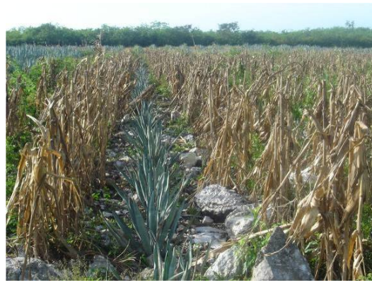
Plantación en desarrollo