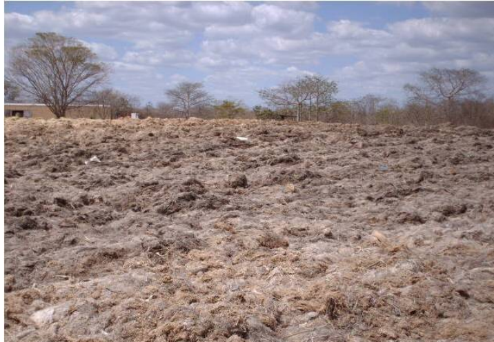
Bagazal en desfibradora, material recomendado para emplearse como sustrato para el semillero