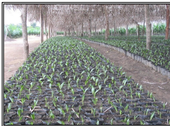
Figura 1. Pre-vivero de palma de aceite en Acapetahua, Chiapas

El éxito en la rentabilidad en el cultivo de la palma de aceite, se basa en el uso de materiales de alta calidad genética, en el manejo adecuado de la semilla y de los viveros, por ello, la producción de planta en vivero tiene como objetivo obtener palmas de alta calidad, para establecer el campo (figura 1).